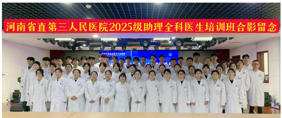
往届助理全科学员合影

目前，我院助理全科医生培训基地已形成一套完整规范的管理与培养体系。2023 年国家助理执业医师技能考试通过率为 83%、2024 年国家助理执业医师技能考试通过率为 97.7%、2025 年国家助理执业医师技能考试通过率为 93.5%。2023 年河南省助理全科结业考试通过率为 88.4%、2024 年河南省助理全科结业考试通过率为 85.7%、2025 年河南省助理全科结业考试通过