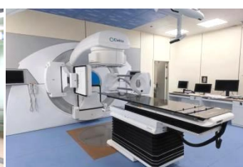
数字减影血管造影

医院科研及教学实力雄厚。是国家卫生健康委临床药理实验研究基地、全国首批四级妇科内镜手术培训基地、国家级 ECMO 培训基地、中国初级创伤救治国家级培训基地、中国食管心脏电生理技术中心、中国残联康复人才培养基地等。