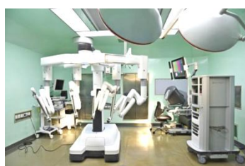
达芬奇手术机器人