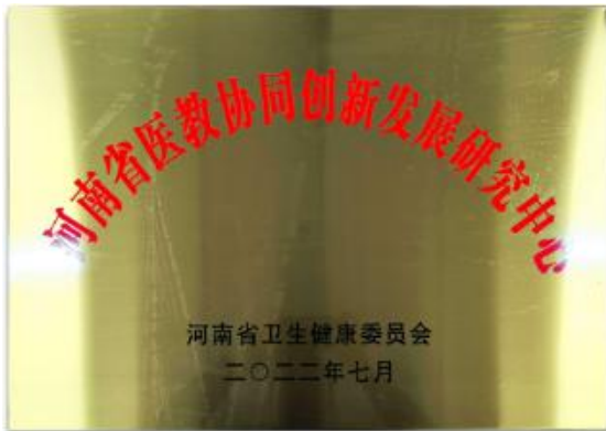
河南省医教协同创新发展研究中心