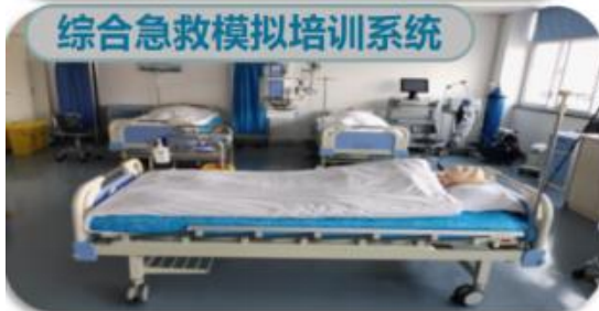
综合急救模拟培训系统