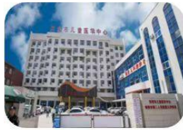
南阳市儿童医学中心

绩效、信息“七统一”管理，还可为考核合格的社会学员提供优质就业岗位，实现规培培养与就业衔接双向赋能。